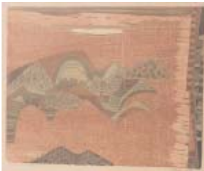
50 Paisaje peruano II (64,5 x 50 cm) Holzschnitt