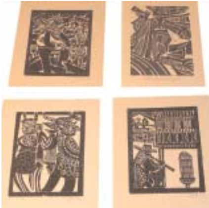
47 (17 x 23 cm) Holzschnitt