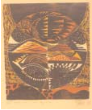
46 Costa (Küste) (34 x 42 cm) Holzschnitt