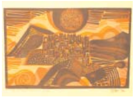
48 ohne Titel (65 x 50 cm) Holzschnitt