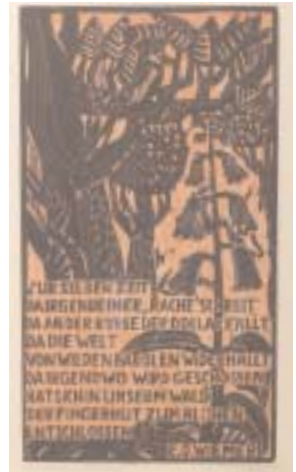
49 Ohne Titel Mit Gedicht von R.O. Wiemer (28 x 50 cm) Holzschnitt